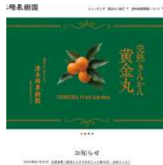
(有)清木場果樹園様