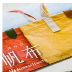
特定非営利活動法人ミーサ・インフォメーション・Net様