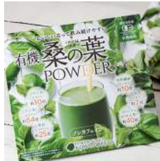
(同)まくらざき桑本舗様