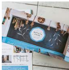
コケットカフェ様