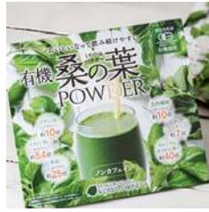
(同)まくらざき桑本舗様