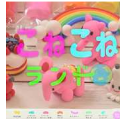
こねこねランド様