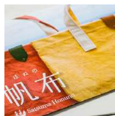
特定非営利活動法人ミーサ・インフォメーション・Net様