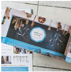
コケットカフェ様