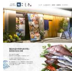
産直旬膳こしき様