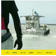
洋丸水産有限会社様