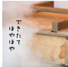
まるはちふくれ菓子店様