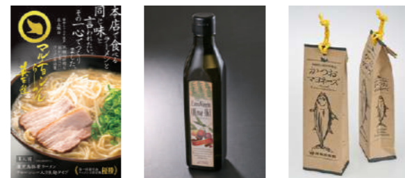
ブランディングロゴ・商品ラベル・パッケージ