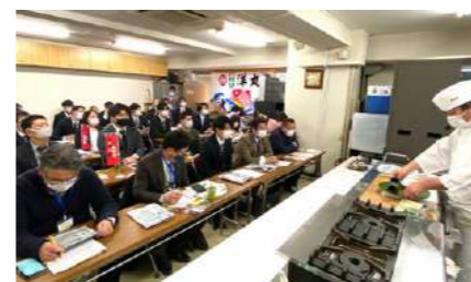
県産食材を使用した料理講習会