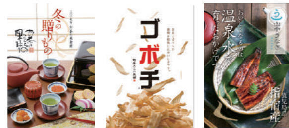
会社案内・カタログ・ポスターなど紙媒体全般