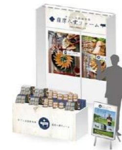
展示会・商談会単体ブース 企画・施工プロデュース

商品企画だけでなく、各種展示会・商談会の企画・デザインなどのコンサルティング業務、セールスプロモーションプロデュース設営も承ります。また、各種補助金を活用し、コスト面も重視した商品展開などのご提案もいたします。