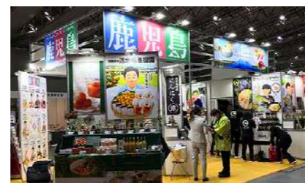
展示会・商談会合同ブース 企画・施工プロデュース