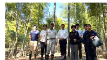
有名シェフを招聘した生産地視察